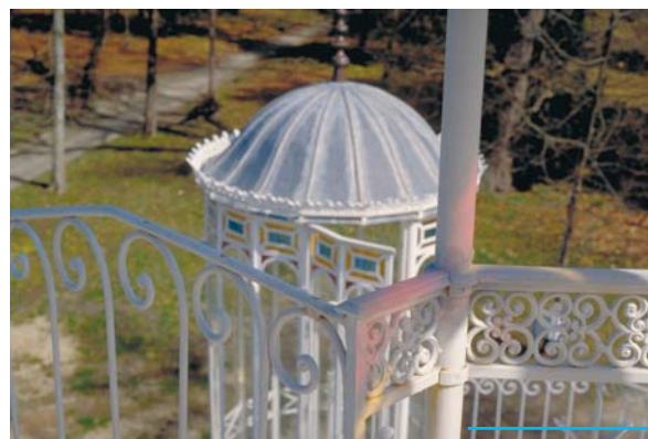
Détail d'une tour située au sud