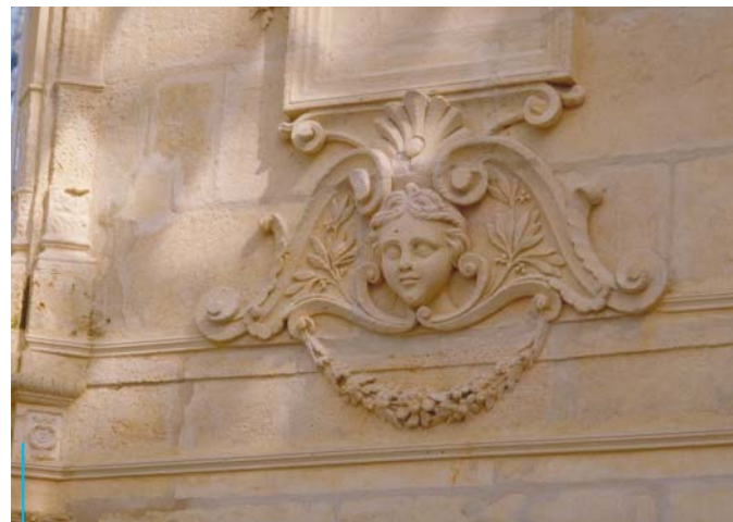
A l'intérieur de la serre, mascaron d'esprit XVIIIe, alors à la mode.