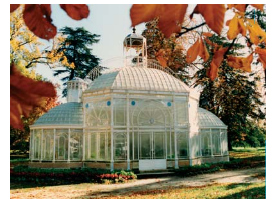
La serre dans le magnifique écrin de Laurenzane