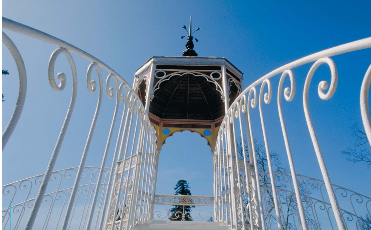
Passerelle accédant au clocheton surmontant la serre