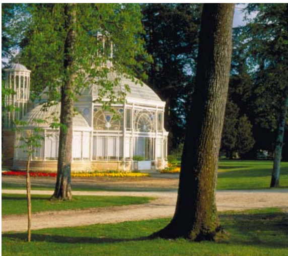
La serre et ses merveilleuses découpures de métal permises par de nouvelles techniques de travail du fer

L'idée de protéger les plantes du froid ne date pas d'hier. Ce sont plutôt les techniques d'isolation qui ont changé. Pendant longtemps on a mis à l'abri les plantes fragiles, le plus souvent à usage comestible, comme on pouvait, ou plutôt comme on savait : caisses entreposées la nuit dans des caves, volets en bois assurant la ventilation, premières orangeries hollandaises chauffées par des poêles en fer ou en faïence. Tous ces systèmes présentaient des inconvénients comme les fumées toxiques ou les effets de loupe provoqués par des vitres de qualité médiocre. En fait c'est au XIXe siècle que les techniques du verre et du fer se perfectionnèrent. On améliora aussi la répartition de la chaleur en remplaçant les poêles d'autrefois par des chaudières placées à l'extérieur de la serre et l'alimentant en eau chaude par tuyaux. La grande vogue des serres allait commencer, et avec elle la mode des plantes exotiques.