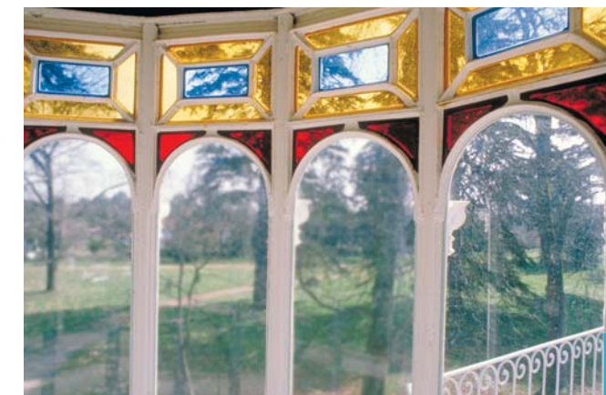
Les verres polychromes sont une nouveauté dans les serres au XIXe siècle.